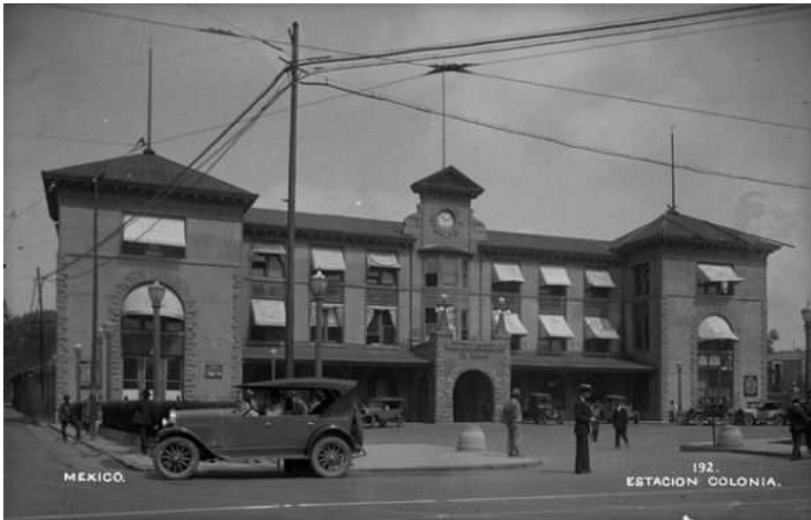
Estación Colonia, Ca. 1928. Número de inventario: 121107.

En la década de los años 20 del siglo pasado el edificio permanecía intacto, con excepción del barandal frontal, que había sido retirado para dar ingreso a los autos que llevaban algunos pasajeros a abordar el tren o iban a recogerlos después de su largo viaje.