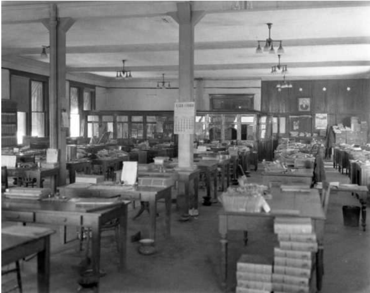
Interior de la oficina de la Superintendencia de Carros. 1926.

En la parte posterior del edificio de la estación, había un gran cobertizo de madera y lámina que cubría los andenes. A su costado se ubicaba el edificio de mampostería y lámina para oficina del Express, así como dos casas de madera y lámina para las oficinas y bodega de la compañía Pullman.