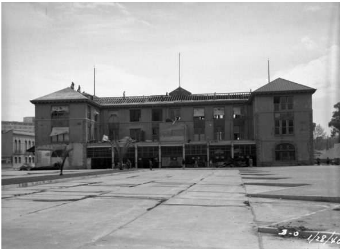
Trabajos de desmantelamiento del edificio de la ex estación Colonia. 28 de enero de 1940.

No sabemos el mes exacto en que terminó la demolición del edificio, en la revista Ferronales solo aparece un pequeño artículo titulado ¡Allí fue Colonia!, publicado en el mes de agosto de 1940, en el que se indica que la estación... ”no es ya más que un recuerdo, recuerdo que pronto habrá de borrarse, que no conocerá la generación que llega. Si acaso algunos estudiosos, amantes de las cosas viejas...”. 14