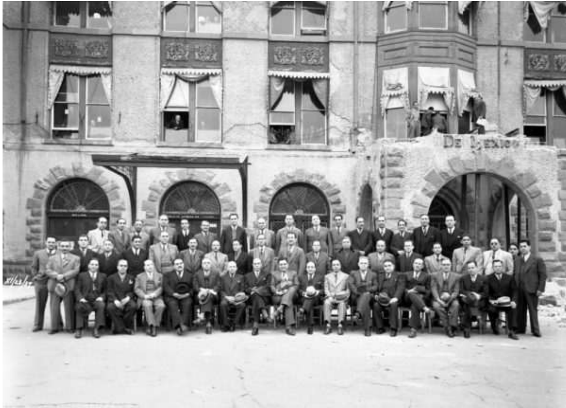
Superintendentes e Ingenieros de División que asistieron a la Gran Convención, 23 de noviembre de 1939.