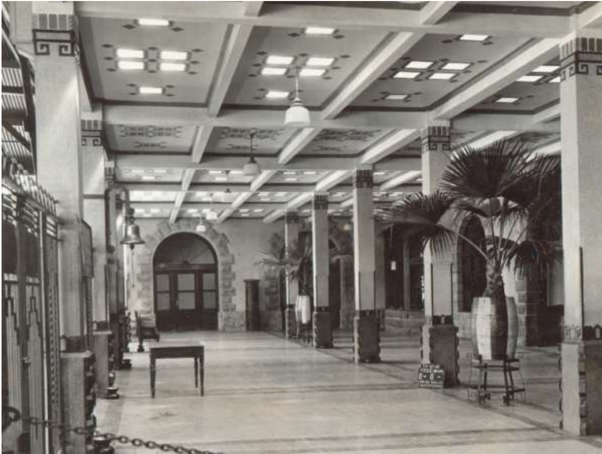
Vestíbulo de la estación Colonia, 1930. Fondo FNM, Sección Comisión de Avalúo e Inventarios. Secretaría de Cultura/CNPPCF/CEDIF.

La planta baja tenía un vestíbulo con columnas centrales provistas de un rodapié de piedra artificial y grecas en la parte superior. Junto a él estaban las salas de espera y expendio de boletos de primera y segunda clases.