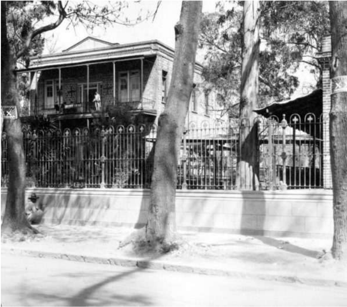
Antiguo hospital Colonia, 1926.

Estos eran los edificios que componían el centro ferroviario de Colonia en la Ciudad de México, hasta el año de 1930. Durante esta década, la estación sufriría cambios sustanciales dentro de su propio funcionamiento, ya que dejaría de operar como estación de pasajeros en septiembre de 1937. 8