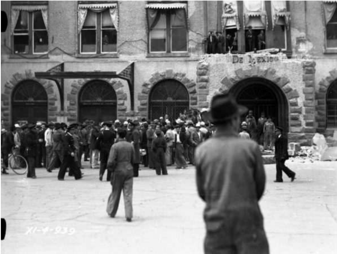
Trabajadores, personal de las oficinas y policías, durante el connato de motín por la demolición del edificio de la ex estación Colonia, 4 de noviembre de 1939.