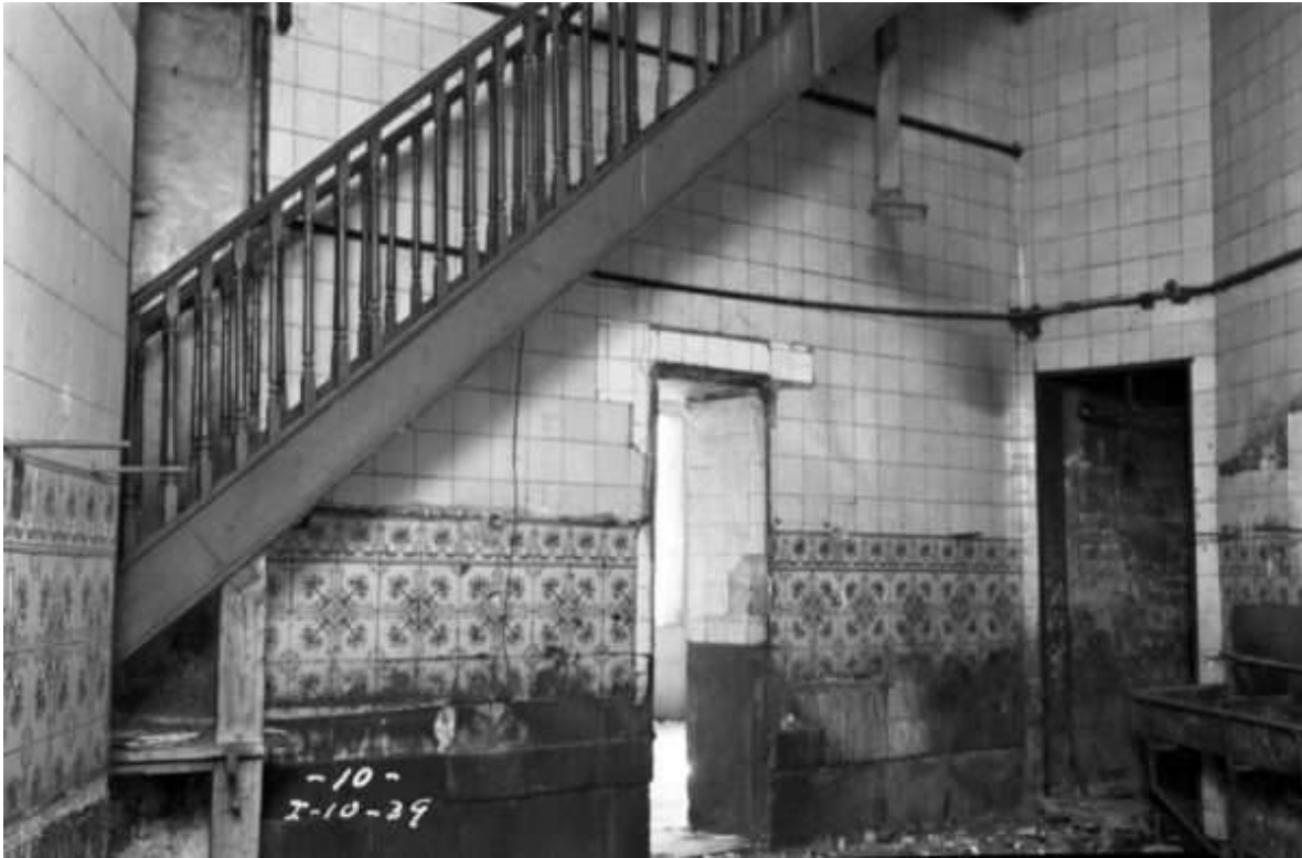
Espacio que fuera la cocina del antiguo café Colón, 10 de enero de 1939. Fondo Ferrocarriles Nacionales de México, Sección Comisión de Avalúo e Inventarios. Secretaría de Cultura/CNPPCF/CEDIF.

Adicionado a este registro fotográfico, a los pocos días llevaron a cabo otro más, ahora al interior de la propia ex estación Colonia, en el que se muestran los diferentes espacios ocupados para oficinas y sus trabajadores.