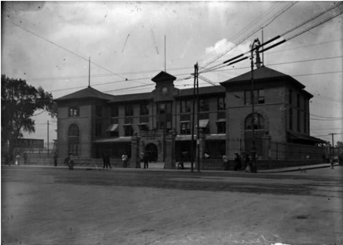
Estación Colonia, Ca. 1918. Número inventario: 5421.

El edificio fue puesto en servicio el 17 de febrero de 1896, saliendo el primer tren de pasajeros de sus andenes a las 4 de la tarde de ese mismo día. 3 La inauguración oficial se llevó a cabo dos años después, con la presencia del entonces presidente de la República, el general Porfirio Díaz. 4 La ubicación de la estación con sus patios estaba delimitada hacia el norte por la calle de Sullivan, al sur por la Calzada de la Teja, al oriente por la Calzada de la Verónica, y al poniente por la calle de Ramón Guzmán. 5