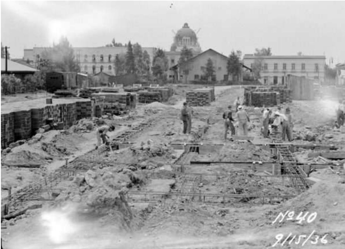
Inicios de la construcción de la estación central de Buenavista, 15 de septiembre de 1936.