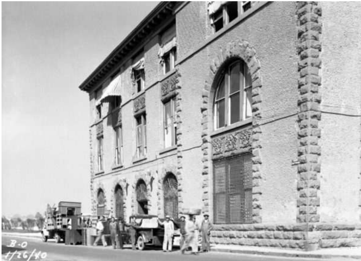
Mudanza de las oficinas instaladas en la ex estación Colonia, 26 de enero de 1940.

Adicionado a los trabajos de desmantelamiento del edificio, se llevó a cabo la mudanza de todos los enseres de las oficinas.