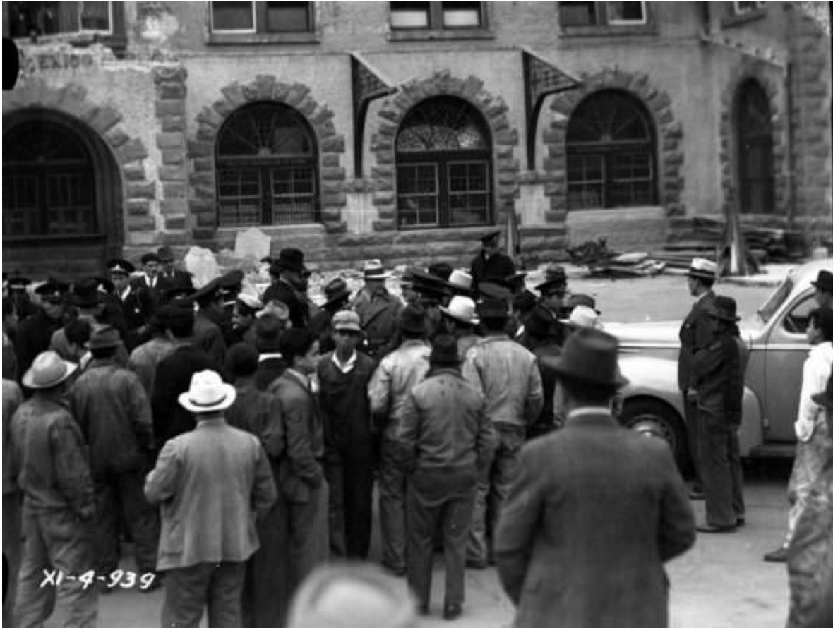
Connato de motín ante la demolición del edificio de la ex estación Colonia, 4 de noviembre de 1939.

A pesar de ello, los trabajos de desmantelamiento de la estación continuaron de forma lenta en el mes de noviembre y se reanudaron actividades en enero, de acuerdo con los registros fotográficos ya señalados. Incluso, un grupo de Superintendentes e Ingenieros de División que asistieron a una convención que se llevó a cabo en el edificio de Ferrocarriles Nacionales de México ubicado en Bolívar número 19, fueron a Colonia a tomarse la foto oficial frente a la fachada, ya en proceso de demolición.