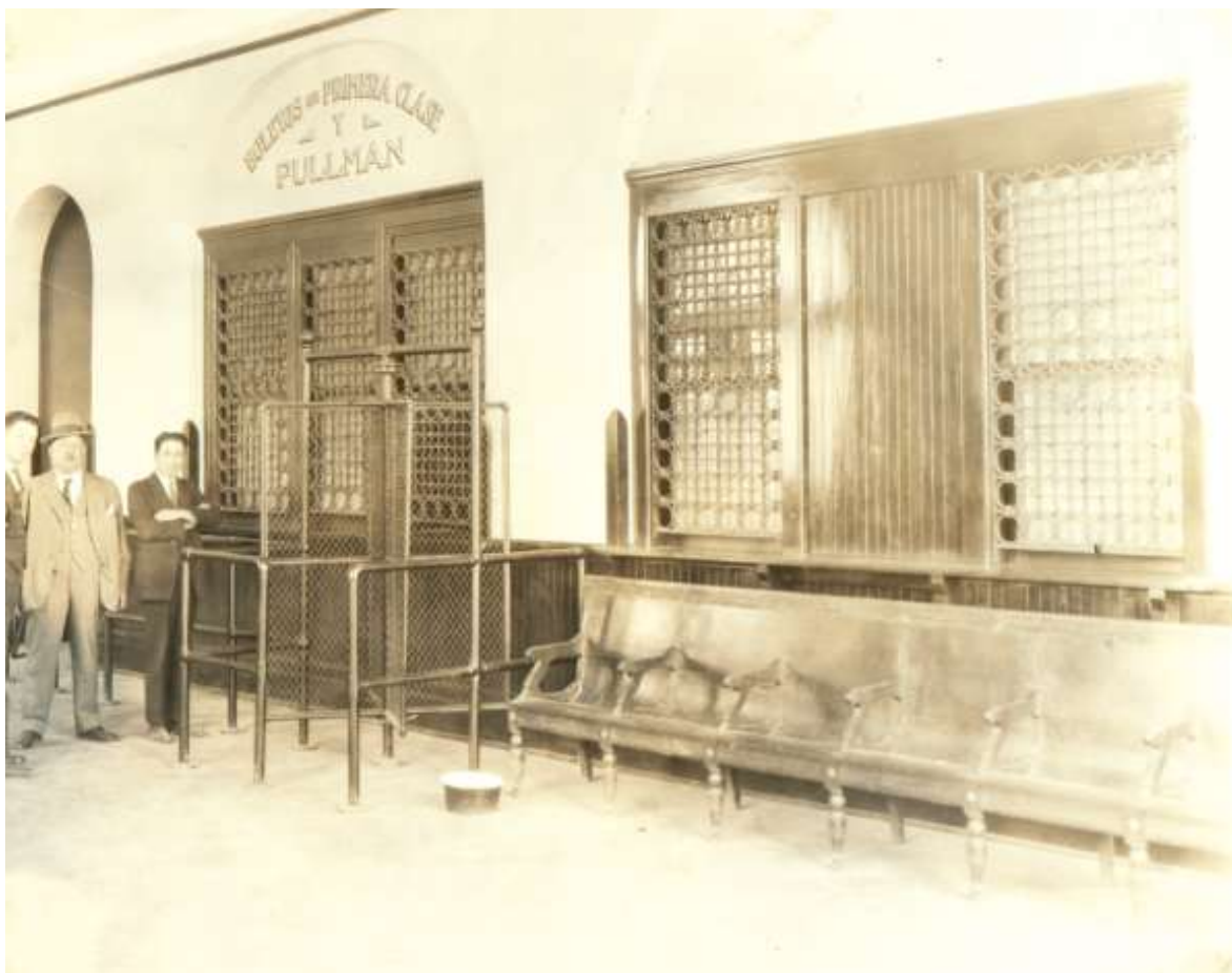
Expendio de boletos y sala de espera de primera clase de la estación Colonia, 1926.

La oficina de telégrafos y la cafetería se encontraban ubicadas junto a la puerta de entrada a los andenes de pasajeros.