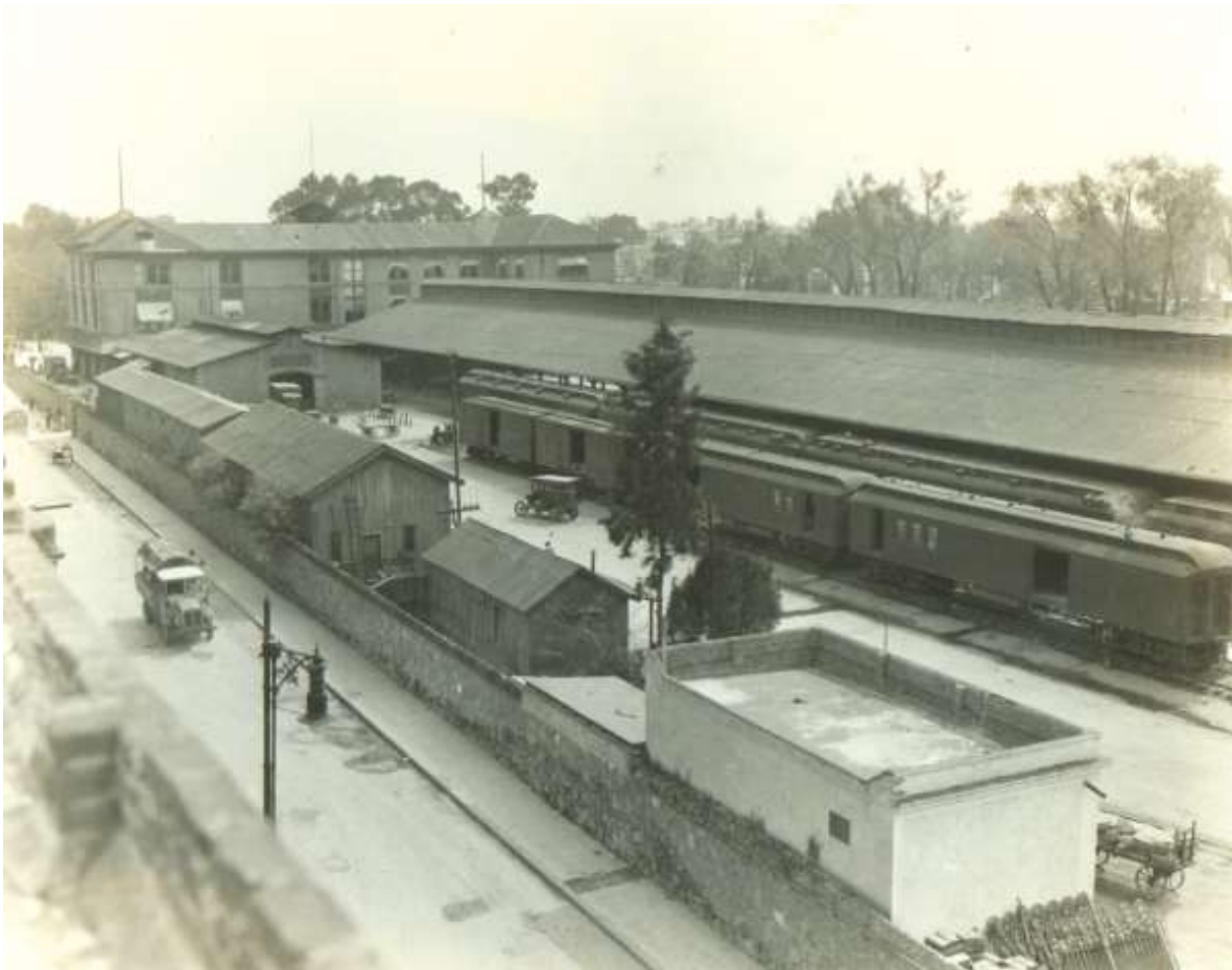
Parte posterior de la estación Colonia, 1926. Fondo FNM, Sección Comisión de Avalúo e Inventarios. Secretaría de Cultura/CNPPCF/CEDIF.

En la misma dirección se encontraba la oficina del inspector de coches, que era una pequeña casa de madera y lámina que tenía junto una caseta de mampostería utilizada como oficina para carros de transbordo, además de un cobertizo de madera y lámina para fraguas, así como el taller de reparación y la oficina para correos.