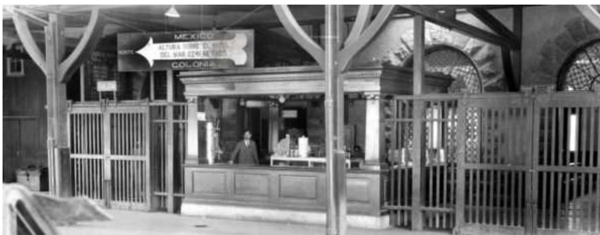
Cafetería de la estación Colonia, 1926. Fondo FNM, Sección Comisión de Avalúo e Inventarios. Secretaría de Cultura/CNPPCF/CEDIF.

La oficina de telégrafos y la cafetería se encontraban ubicadas junto a la puerta de entrada a los andenes de pasajeros.