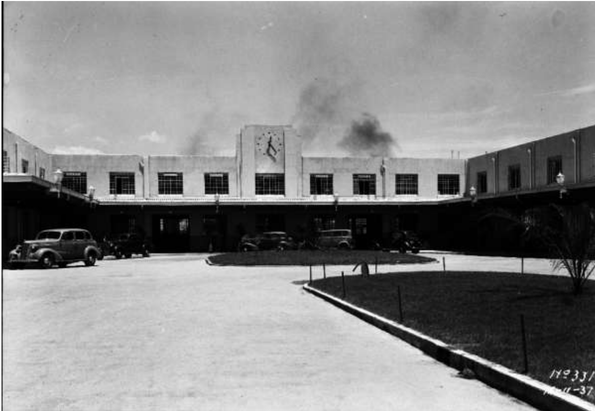
Estación central de Buenavista, días previos a su inauguración, 2 de septiembre de 1937.

Debido a esto, el tráfico de pasajeros y Express se trasladó a la nueva estación, y el edificio de la ex estación Colonia permaneció en pie para albergar algunas de las oficinas de los propios ferrocarriles, aunque no por mucho tiempo, ya que un año después, con la Administración Obrera al frente de la empresa ferroviaria, se informaba que el edificio sería demolido en enero de 1939. 12