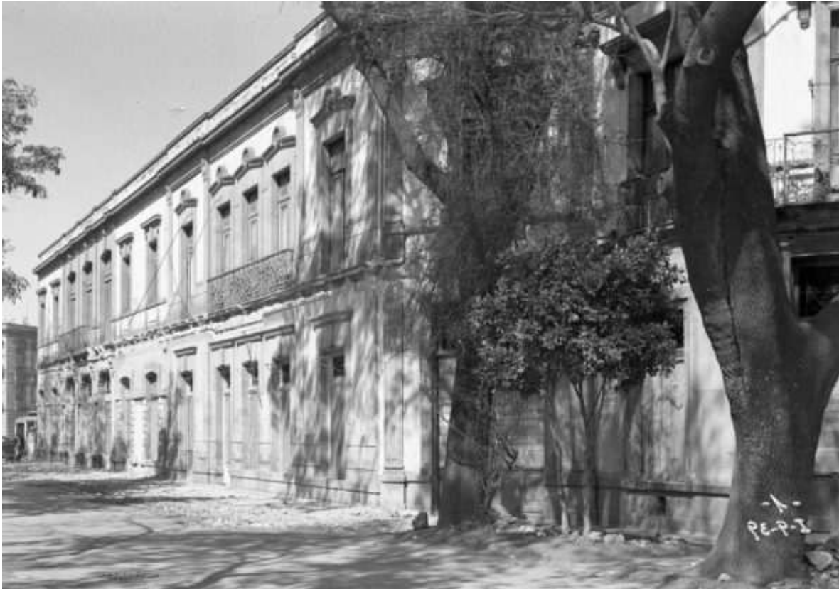
Fachada principal del edificio del antiguo café Colón, 9 de enero de 1939.

Personal de la empresa ferroviaria realizó un registro fotográfico del edificio propuesto por la Secretaría los primeros días de enero de 1939, donde se registró el abandono y deterioro que tenía la construcción.